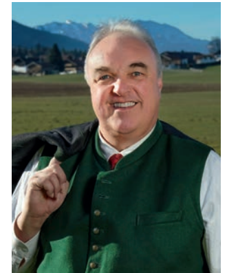
Norbert Kerker 1. Bürgermeister