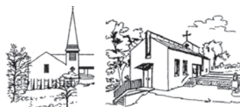
Erlöserkirche Gmund Heilig-Geist-Kirche Schaftlach

Evangelisch-Lutherische Kirchengemeinde 83703 Gmund a. Tegernsee Kirchenweg 15 E-Mail: pfarramt.gmund@elkb.de