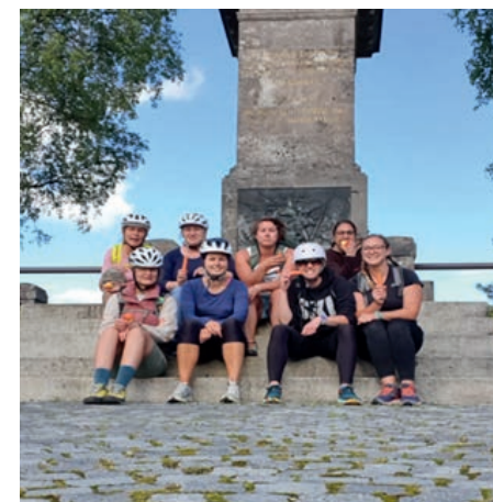
Nicht auf dem Bild sind Andreas Lachenmaier und Rebecca Eßer

Infos zur Anzeigenschaltung unter 0 80 24 / 99 89 0 oder per Mail: mail@landzeit.info