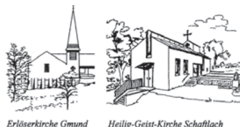
Erlöserkirche Gmund Heilig-Geist-Kirche Schaftlach

Evangelisch-Lutherische Kirchengemeinde 83703 Gmund a. Tegernsee Kirchenweg 15 E-Mail: pfarramt.gmund@elkb.de