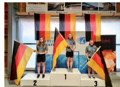
Zielwettbewerb Damen Einzel