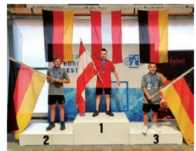
Zielwettbewerb Herren Einzel