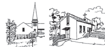
Erlöserkirche Gmund Heilig-Geist-Kirche Schaftlach

Evangelisch-Lutherische Kirchengemeinde 83703 Gmund a. Tegernsee Kirchenweg 15 E-Mail: pfarramt.gmund@elkb.de