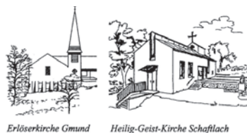
Erlöserkirche Gmund Heilig-Geist-Kirche Schaftlach

Evangelisch-Lutherische Kirchengemeinde 83703 Gmund a. Tegernsee Kirchenweg 15 E-Mail: pfarramt.gmund@elkb.de