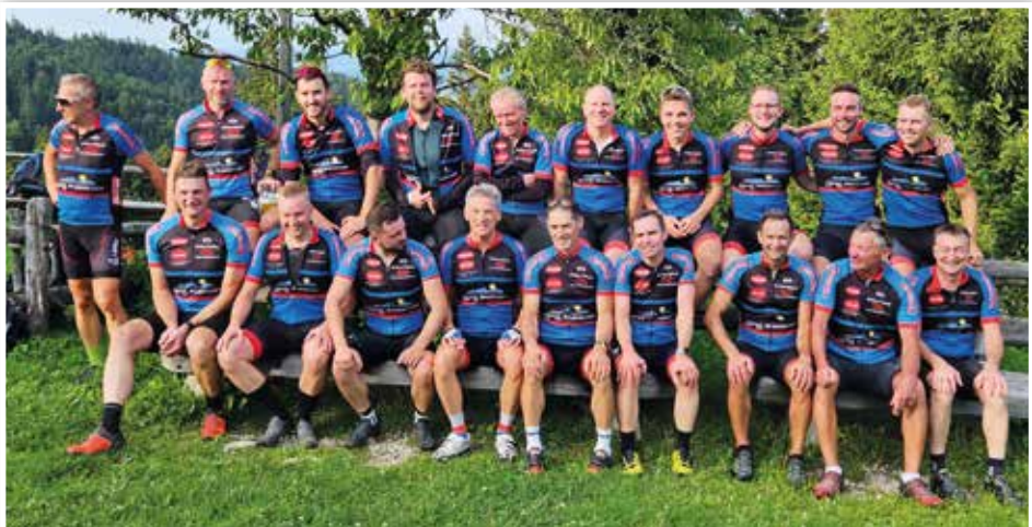
Vereinsmeisterschaft 2023 auf der Sigriz Alm

Bei Interesse sind alle Informationen zum Verein und Ausfahrten auf unserer Homepage www.rsc-waakirchen.de zu finden.