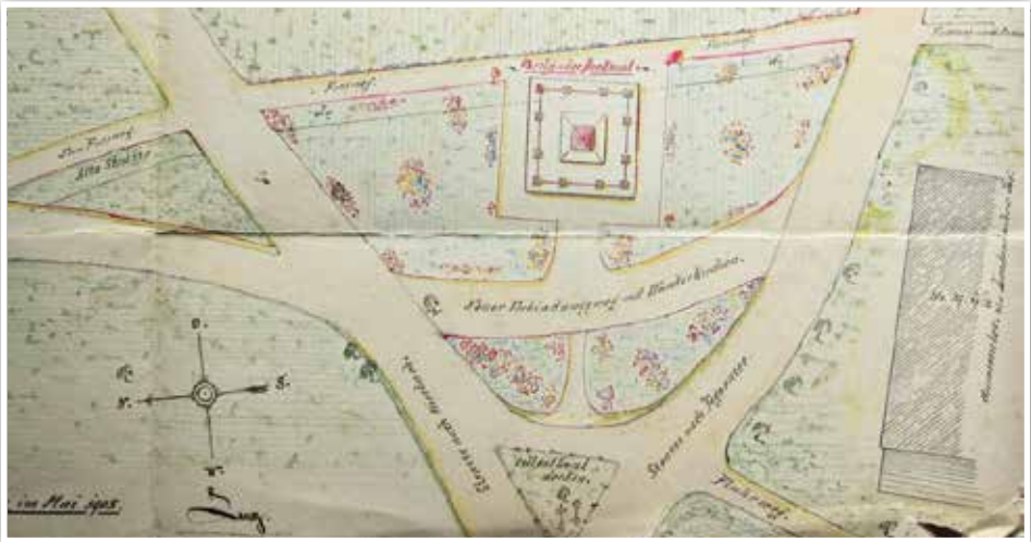
Lageplan Waakirchen Mai 1905