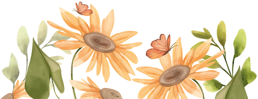
Norbert Kerker 1. Bürgermeister