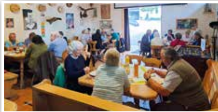
Stimmungsvolle Atmosphäre beim offenen Grillabend des VdK Ortsverbandes Schaftlach-Waakirchen 2023

Nichtmitglieder, Interessierte und Gönner sind herzlich willkommen.