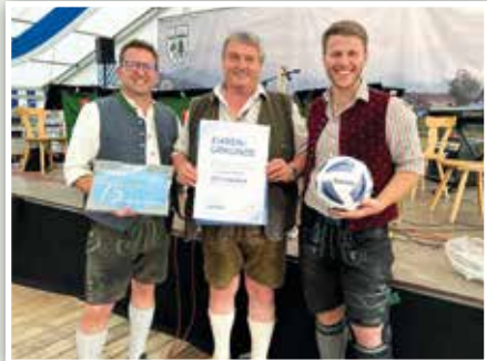
Bericht im Heft

Festabend zur 75-Jahrfeier vom TSV Schaftlach