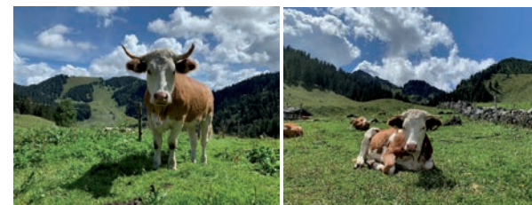
Fleckvieh an der Bodenschneid.